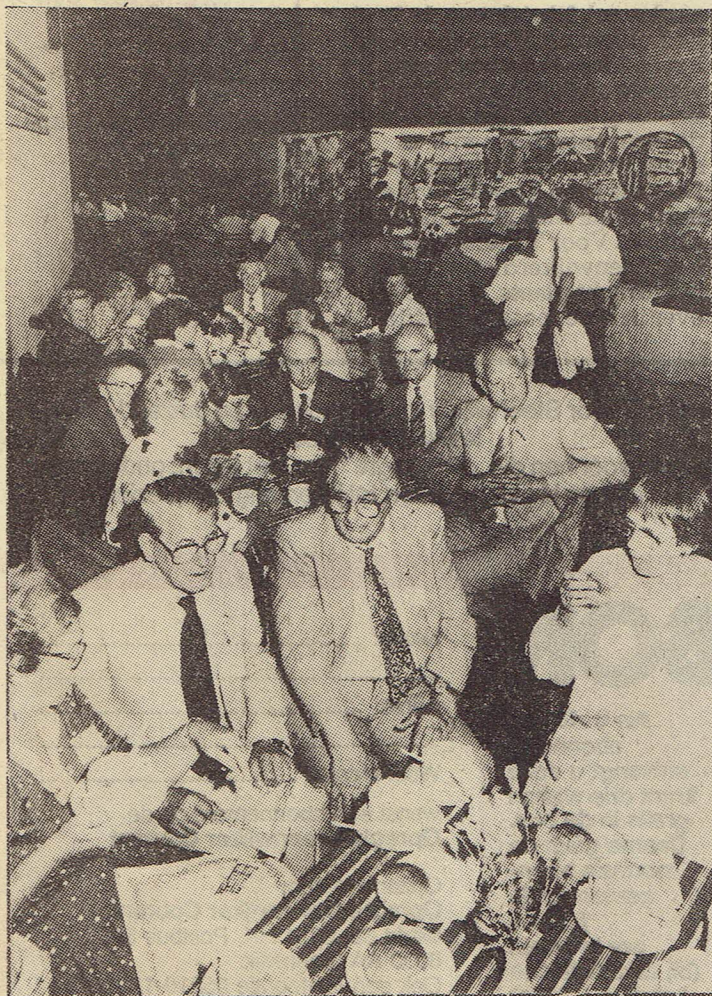
● Oostra's van de „Steenwijker” tak zochten elkaar op in De Meenthe.

STEENWIJK – Een kleine 500 Oostra's uit alle delen van het land kwamen zaterdag naar De Meenthe voor een (familie)reünie. In de theaterzaal en op de omliep van het streekcentrum werd het een bijzonder gezellige dag. Een ontmoeting en herkenning van Oostra's met als hoogtepunt de aanbieding van het eerste exemplaar van het boek „Oostra, een Stellingwerfer geslacht” aan de Stellingwerfer Schrieversronte”. Een boek dat later ook volop in de belangstelling stond van de verzamelde Oostra's.